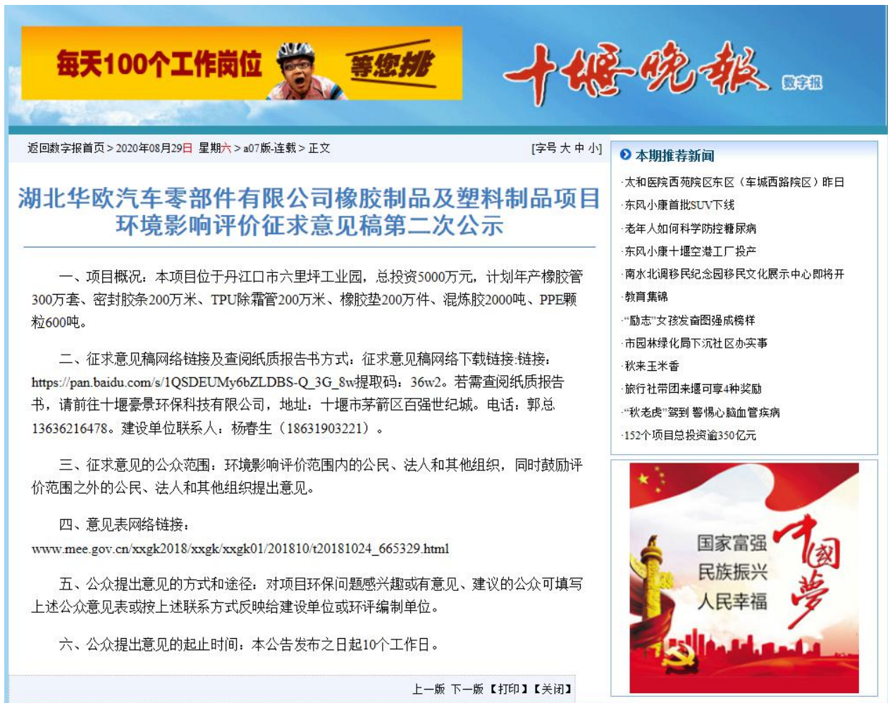
图 4 第二次报纸公示（8月29日）