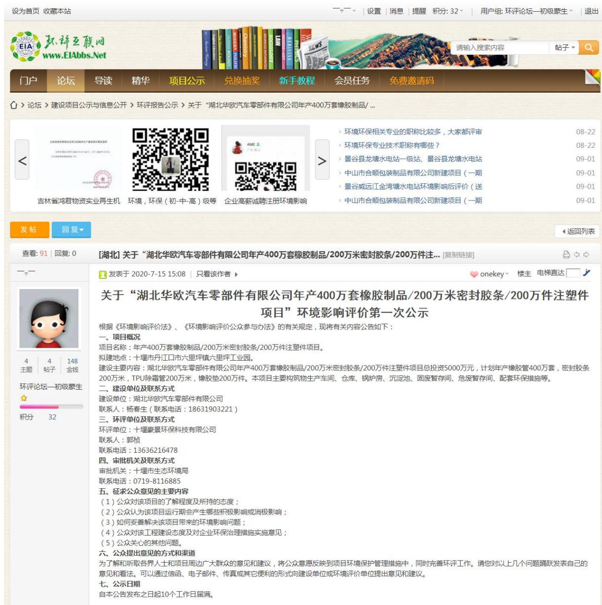
图1 第一次网络公示截图

橡胶制品及塑料制品项目首次公示网站为环评互联网网站，网站信息面向全社会公开，网络公开选取的载体满足《环境影响评价公众参与办法》的相关要求。本项目首次环境影响评价信息公示网址为 https://www.eiabbs.net/forum.php?mod=viewthread&tid=312145&fromuid=126751 。网络公示时间涵盖了环境影响报告书征求意见稿编制的全过程，公示截图见图1。