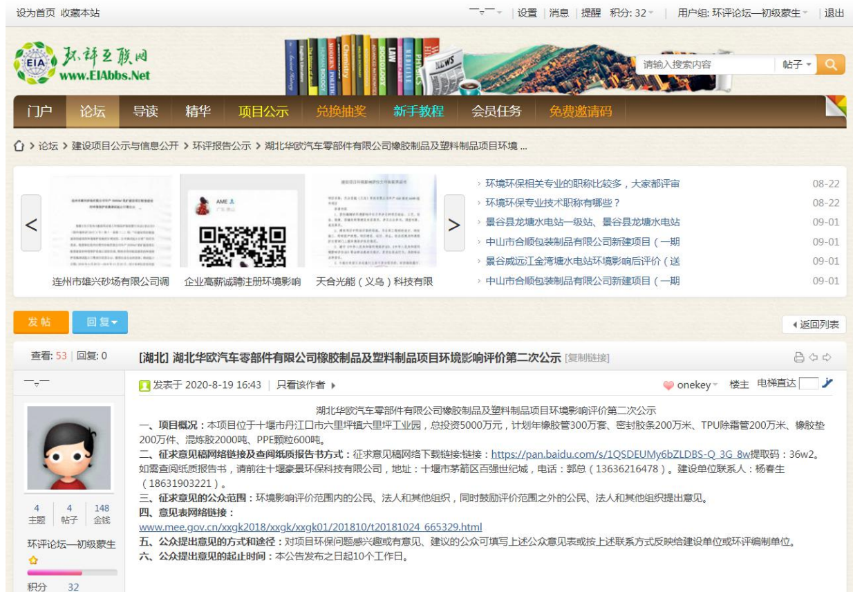
图 2 征求意见稿网络公示截图